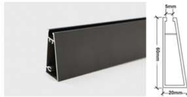
1240 پروفیل دستگیره درب کمد و کابینت مدل فرنج ۴ متری رنگ مشکی مات