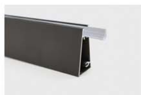
1250 گسکت شفاف نگهدارنده شیشه جهت پروفیل فرنج ۳ متری