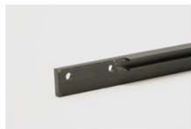
1241 کپ درپوش بالا و پایین ساده مدل فرنج ۴۰ سانتیمتری