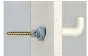
نصب دو مرحله ای